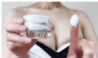
①クリームを適量とります。