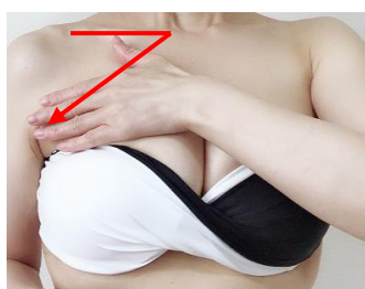
⑤矢印に沿って鎖骨を通り脇の下へ流すようにマッサージします。