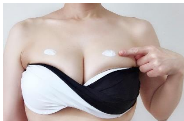
②バストにつけます。